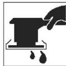
Szlifować mechanicznie na mokro